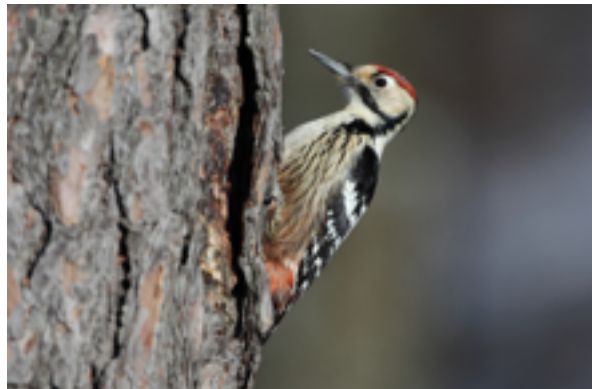
Der seltene Weißrückenspecht zimmert seine Höhlen in dicke, alte Buchen und lebt nur in totholzreichen Wäldern. Er ist auch im Perchtoldsdorfer Wald nachgewiesen.