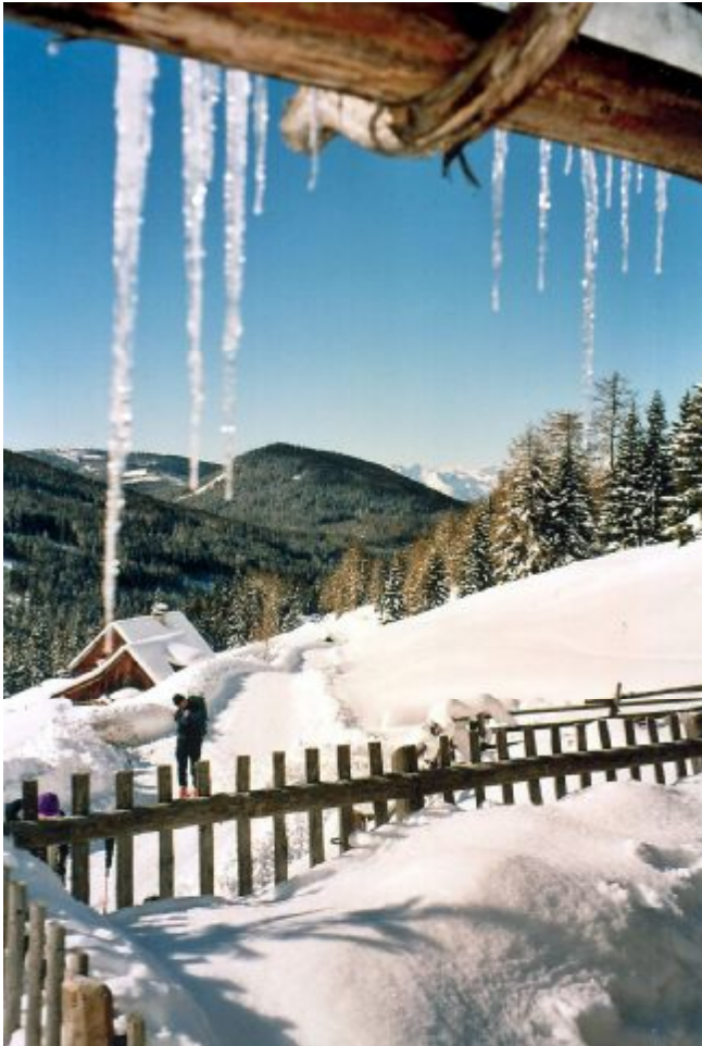
Rast bei der Dorfnerhütte