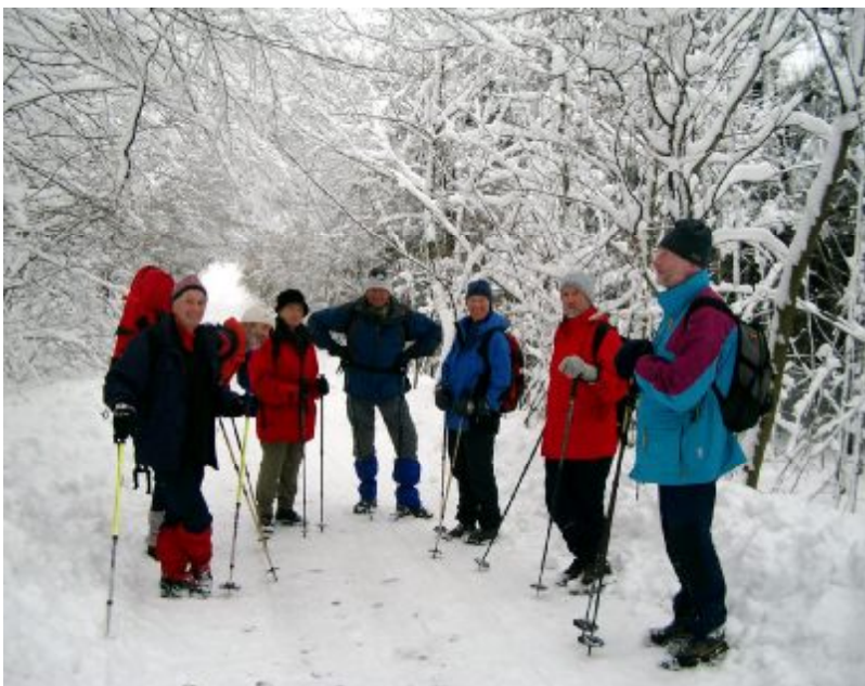
Winterwanderung im tief verschneiten Wiener Wald

Für den 16. Februar waren ergiebige Schneefälle vorhergesagt und die Wettervorhersage stimmte genau. Unsere 1. Mittwochswanderung in diesem Jahr war für diesen Tag angesetzt. Trotz dieses Wetters waren 9 unserer Mitglieder nicht aufzuhalten. Wir trafen uns im Bus 255 nach Kaltenleutgeben und schon waren wir an der Haltestelle Ellinggraben und los ging es. Der frische Schnee lag kniehoch und Spuren gab es natürlich nicht. Ideale Voraussetzungen für Schneeschuhe, die aber lediglich Manfred dabei hatte. Die Wanderung war wunderschön. Die Stimmung im Schneefall und der unberührten Landschaft einfach bezaubernd. Pünktlich wie geplant erreichten wir nach 2,5 Stunden die Höllensteinhütte. Erstaunlicherweise waren Wirtin und Wirt auch da. Wir waren natürlich die einzigen Gäste und bereiteten uns in der ganzen Gaststube aus. Bier und Essen hat allen gut geschmeckt und frohen Mutes ging es über die geräumte Forststrasse zurück nach Rodaun. Auf Wunsch einer einzelnen Dame mussten wir noch Kaffee und Kuchen in der Kammersteiner einnehmen. Dort hätten wir uns fast verplaudert. Gerade rechtzeitig um in der Dämmerung zu Hause anzukommen, wurde zum Aufbruch gedrängt. Ein in jeder Hinsicht wunderbarer Ausflug war es trotz oder vielleicht gerade wegen des Wetters.