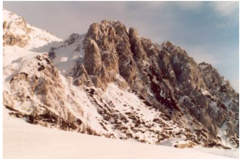
Pistenschilauflauf mitten in den Karnischen Alpen

Das Naßfeld auf einer Seehöhe um die 2000 Metergrenze war heuer das Ziel unserer Schiwoche. Von Perchtoldsdorf fuhren wir - insgesamt 12 Personen - mit dem Vereinsbus und zwei PKWs zu unserer Pension nach Tröpollach , einem kleinen Dorf am Fuße der Naßfeldstraße. Das Quartier im Zentrum des Orts war nur wenige Minuten von der Millenniums-Gondelbahn entfernt, sodass wir morgens zu Fuss die Aufstiegshilfen zu den insgesamt über 100 km bestens präparierten Pisten erreichen konnten. Das sonnige aber sehr kalte Wetter garantierte, dass der Schnee den ganzen Tag über Fahrgegnuss bot, die -19° bewirkten aber auch so manchen Einkehrschwung unterwegs. Als Abendvergnügen übten wir uns auch im Eisstockschiessen - das Ergebnis ließ aber einem Könner bestenfalls ein müdes Lächeln auf die Lippen kommen. Aber Hauptsache es war Spass dabei und schließlich ging das Duell der Damen gegen die Herren mit einem Remis aus. Am Mittwoch abends fuhren wir nach Hermagor in die neu umgebaute Kletterhalle der dortigen Hauptschule um uns Anregungen zu holen, wie wir vielleicht unsere Kletterwand in der Sebastian-Kneipp-Gasse in Zukunft erweitern könnten. Die 9 Besucher waren jedenfalls beeindruckt. Die Unterbringung und Verpflegung in unserer Pension waren sehr gut und am Ende der Woche fuhren wir gesund und zufrieden nach Hause.