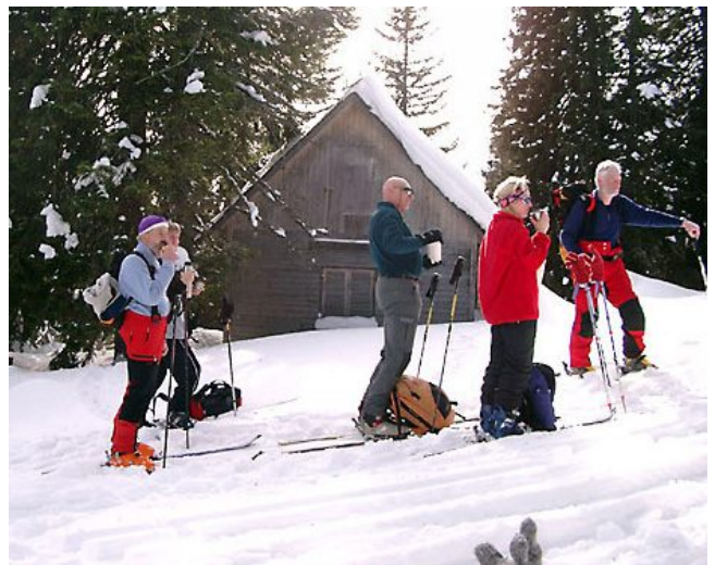
Bei der Jagdhütte auf der Wildalpe