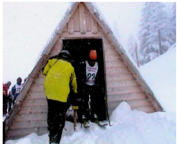
Start zum Riesentorlauf